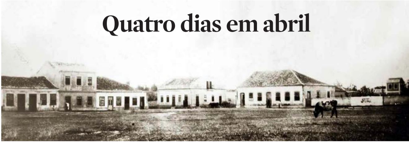
Praça em frente à Igreja (hoje, catedral) Nossa Senhora da Conceição do Arroio, onde maragatos acamparam, em 1895

Embora com episódios menos conhecidos, a Revolução Federalista (1893-1895) também atingiu o litoral norte gaúcho. A guerra civil que opôs os republicanos de Júlio de Castilhos (1860-1903), chamados de pica-paus, e os federalistas de Gaspar Silveira Martins (1835-1901), chamados de maragatos, deixou vítimas na região com os mesmos requintes de crueldade ocorridos no restante do Estado. Assassinatos de parte a parte ocorreram antes mesmo da deflagração da guerra civil.